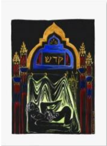
Dorothea Moerman, Holy, 2023, Linoldruck, 22,86 x 30,48 cm