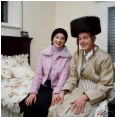
Benjamin Reich, Untitled (from series Divine connection) 2005, Fotografie, 110 x 110 cm

Courtesy of the artist © Benjamin Reich, Berlin HighRes auf Anfrage