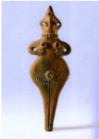
Fruchtbarkeitsstatuette, Syrien, Mittlere Bronzezeit, Terrakotta, 12,8 cm; National Maritime Museum, Haifa