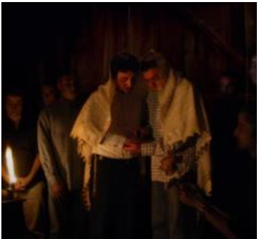
Yitzchak Woolf, A Jewish Wedding, 2008, Ausstellungsprint, 80 x 86 cm