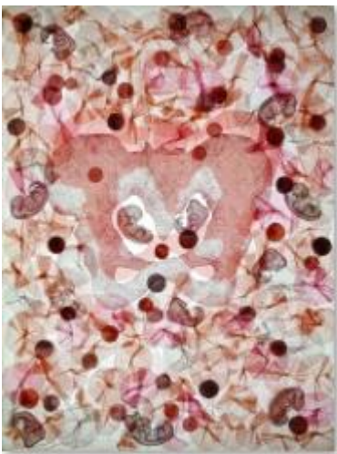
Andi LaVine Arnovitz, Be Fruitful and Multiply, 2019, Papier, Wasserfarben, Textil, 103 x 77,5 x 7 cm